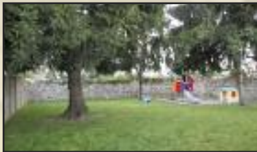
Cour de l'école maternelle

☞ Engazonnement de la cour de l'école maternelle