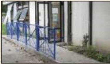
Accessibilité école maternelle

☞ Travaux de sécurisation de la rampe d'accessibilité à l'école maternelle