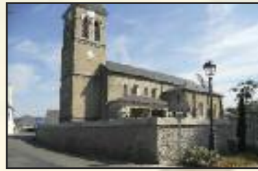
Mur de l'église

☞ Réfection du mur du cimetière de l'église