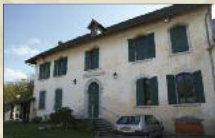
Façade Nord de la mairie Avant